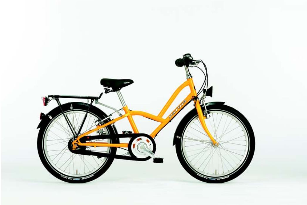
SKIPPY, Shimano 8-Gang, melonengelb

Durchschnittlich benötigt ein Kind bis zum zehnten Lebensjahr 2-3 herkömmliche Fahrräder. Das SKIPPY hingegen wächst einfach mit. Durch die hohe Ausstattungsqualität ist das Skippy für langen Gebrauch gerüstet, und Ihr Kind fährt immer sicher und souverän.